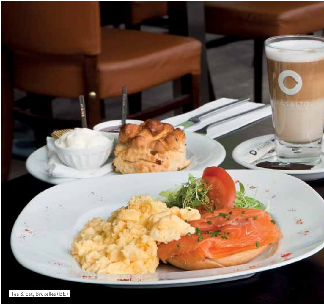
Tea & Eat, Bruxelles (BE)